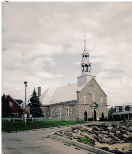
L'église de Saint-Sulpice (1832)

finalement en 1832 que l'église actuelle est construite d'après les plans de Victor Bourgeau. C'est le 23 mai 1832 que l'abbé Antoine Tabeau, vicaire général du diocèse de Québec procéda à la bénédiction de la nouvelle église.