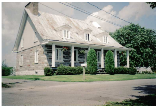
Maison Perreault-Lamontagne (1819)

Les villes de L'Assomption, de l'Épiphanie ainsi que la paroisse, les municipalités de Saint-Jacques, Sainte-Marie-Salomée, Saint-Alexis et Saint-Liguori sont des détachements, en tout ou en partie, de la seigneurie de Saint-Sulpice.