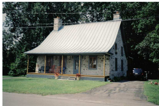
Maison Duhamel (1798-1799)

la maison Gour-Mongeau, localisée au 702, rue Notre-Dame et construite vers 1820, se caractérise par son toit mansard.