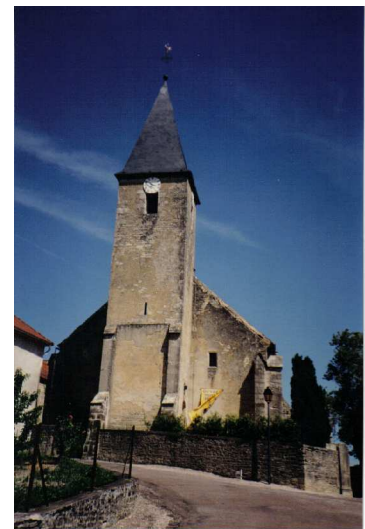
Église de Darcey

Benjamin Sulte affirmait dans Mélanges historiques : « Rien ne nous indique de quelle partie de la France Nicolas Perrot venait », on sait maintenant qu'il venait de Darcey, en Bourgogne.