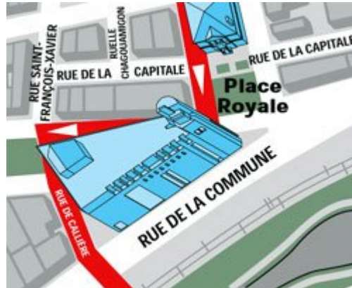
Musée de la Pointe-à-Callière

Elle est située sur la rue Saint-Gabriel (2 e rue à l'Est du boulevard Saint-Laurent) plus précisément au sud de la rue Notre-Dame (entre Notre-Dame et Saint-Paul).